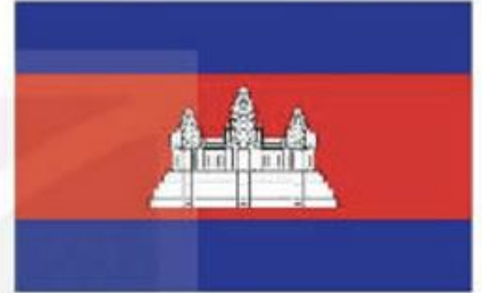
Hình 1. Quốc kì Vương quốc Cam-pu-chia

Ăng-co Vát là quần thể đền đài tại Cam-pu-chia, thu hút du khách hàng đầu nước này. Công trình là đỉnh cao của phong cách kiến trúc Khor-me, trở thành biểu tượng của đất nước và xuất hiện trên Quốc kỳ Cam-pu-chia.